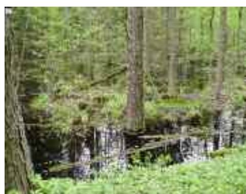
Figura 2. Una serie de pequeñas charcas en Loddington (Reino Unido, izquierda) y charcas estacionales en terraza que retienen el agua del invierno en Bielowieza (Polonia, derecha), uno de los bosques europeos mejor conservados.

Por su parte, las charcas artificiales en terrenos aluviales son ya parte integrante de las estrategias de prevención de inundaciones, como ocurre en las llanuras aluviales de captación tributarias del río Meuse. Con frecuencia, estas charcas se incluyen en proyectos de rehabilitación de los ríos (como en el caso del bajo Rin).